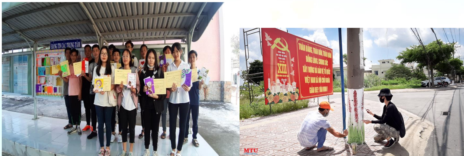
(Hình ảnh lưu niệm / Hình ảnh hoạt động)